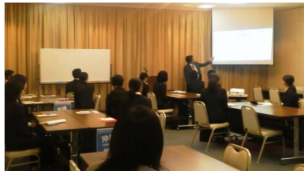
沖縄就職セミナー 30名参加

沖縄就職サポート実施中。 セミナー形式、個別のカウンセリング、面接対策、応募書類の添削など。