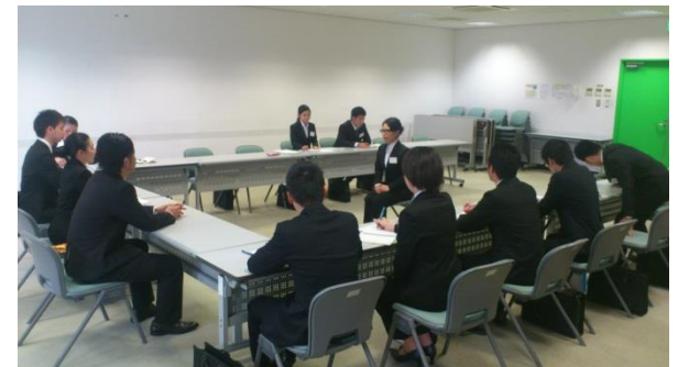
面接対策セミナー 15名参加